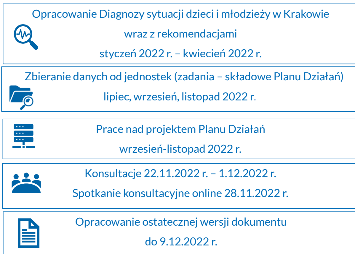
Grafika 1. Harmonogram prac nad Planem Działań

Dokument uwzględnia także wnioski i uwagi z konsultacji społecznych, które przeprowadzono w terminie 22.11.2022 r. - 1.12.2022 r. z podmiotami wskazanymi przez Urząd Miasta Krakowa: lokalnymi organizacjami pozarządowymi działającymi na rzecz dzieci i młodzieży, Młodzieżową Radą Krakowa, Komisją Dialogu Obywatelskiego ds. Młodzieży oraz instytucjami pomocowymi (np. MOPS w Krakowie). W ramach konsultacji zrealizowano spotkanie online, które odbyło się 28 listopada 2022 r. w godzinach 10.00 - 12.00 za pomocą platformy Zoom. Celem spotkania było przedstawienie struktury Planu Działań oraz dyskusja wokół głównych założeń dokumentu, m.in. w kontekście potrzeb i rekomendacji określonych w Diagnozie. W spotkaniu uczestniczyło 9 osób. W okresie trwania konsultacji uwagi do wstępnej wersji dokumentu zbierano również w formie elektronicznej, m.in. poprzez formularz online.